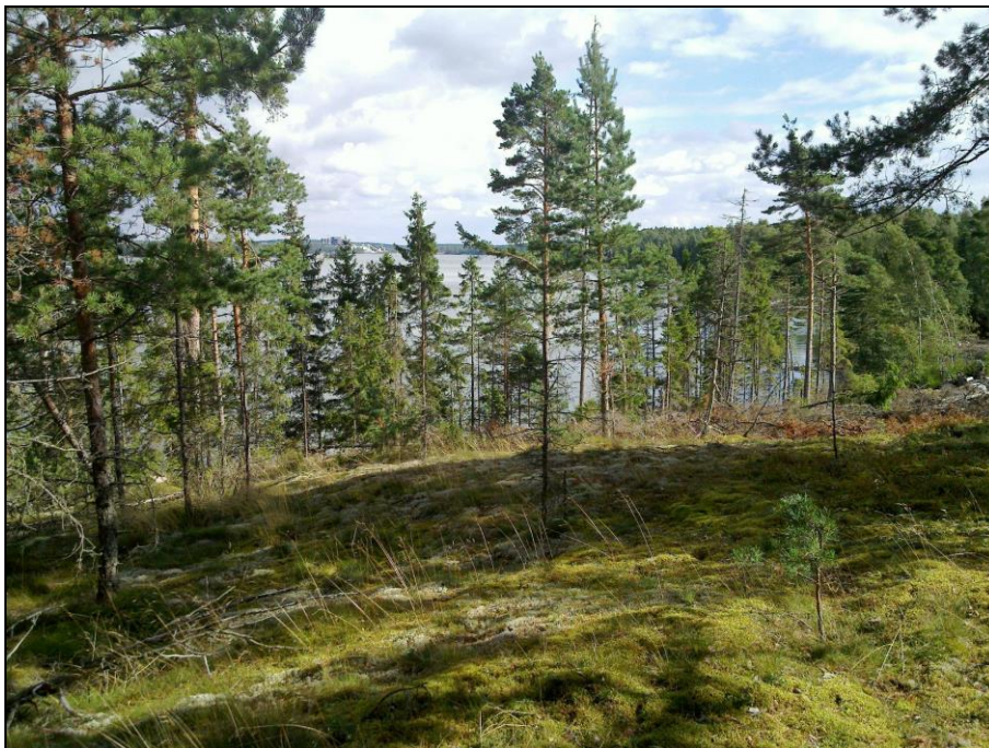
Näkymä saaren koillisosasta, korkeimman mäen laelta koilliseen.