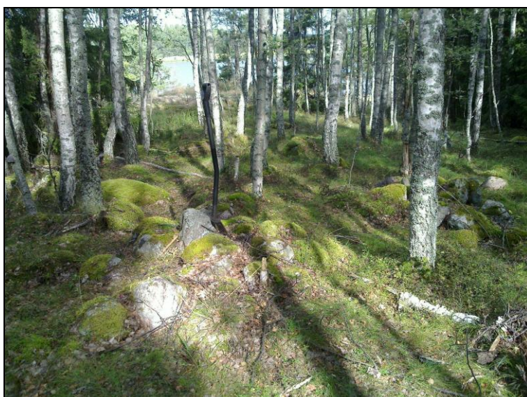
Kiviraunio (uuni koivun takana oik). Pohjoiseen.