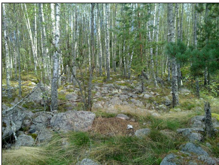
Saaren länsi- ja keskiosan kallioiden välistä kivikkoa.