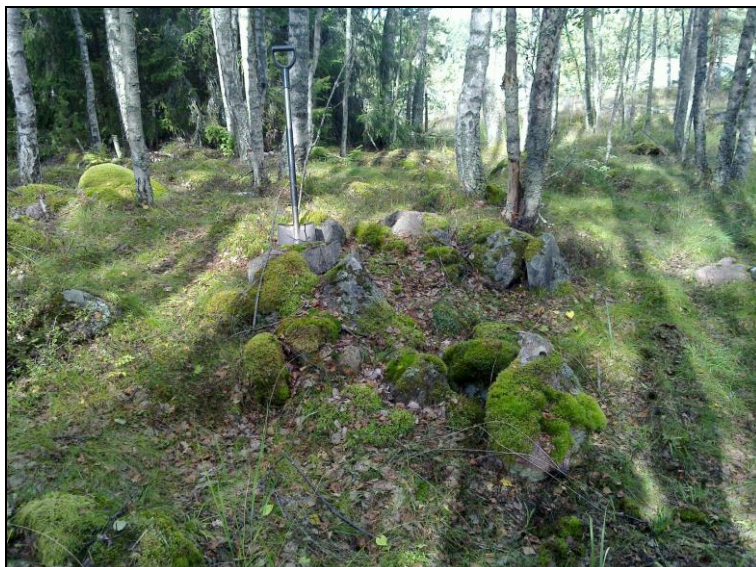
Mahd uunin jäännne. pohjois-luoteeseen. Alla itään.