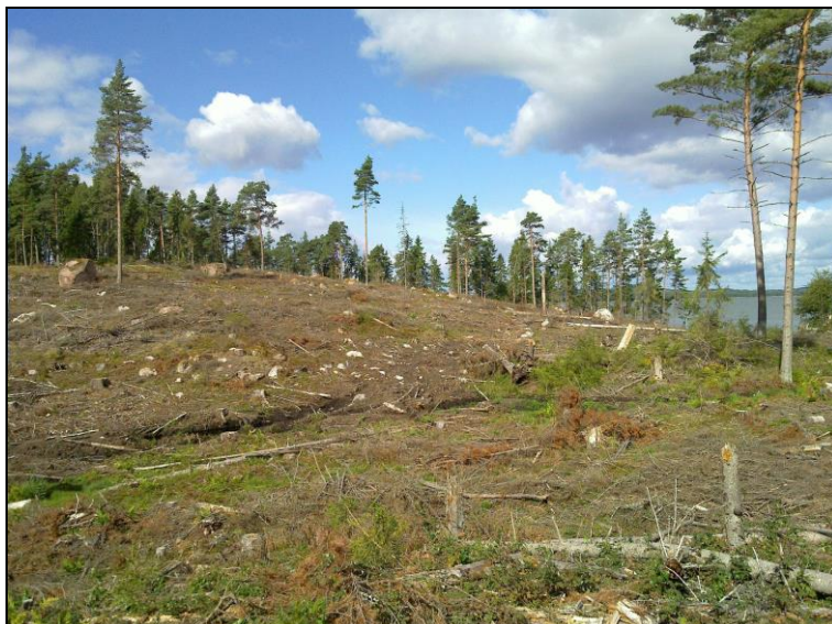
Koillisosaa, saaren korkein mäki, länsi-luoteeseen