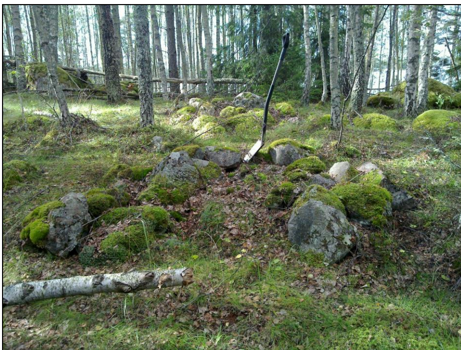
Mahd. uuninjäännö. Takana kiviraunio. Länteen.