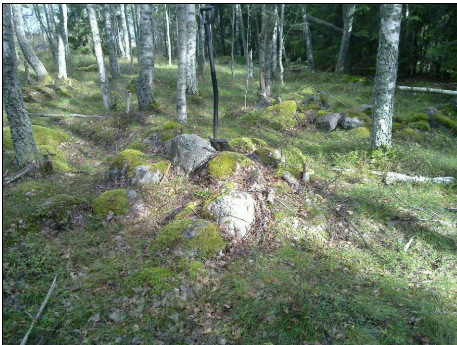
Kiviröykkiö sen takana oik. mahd. uuninraunio. Kuvattu koilliseen.